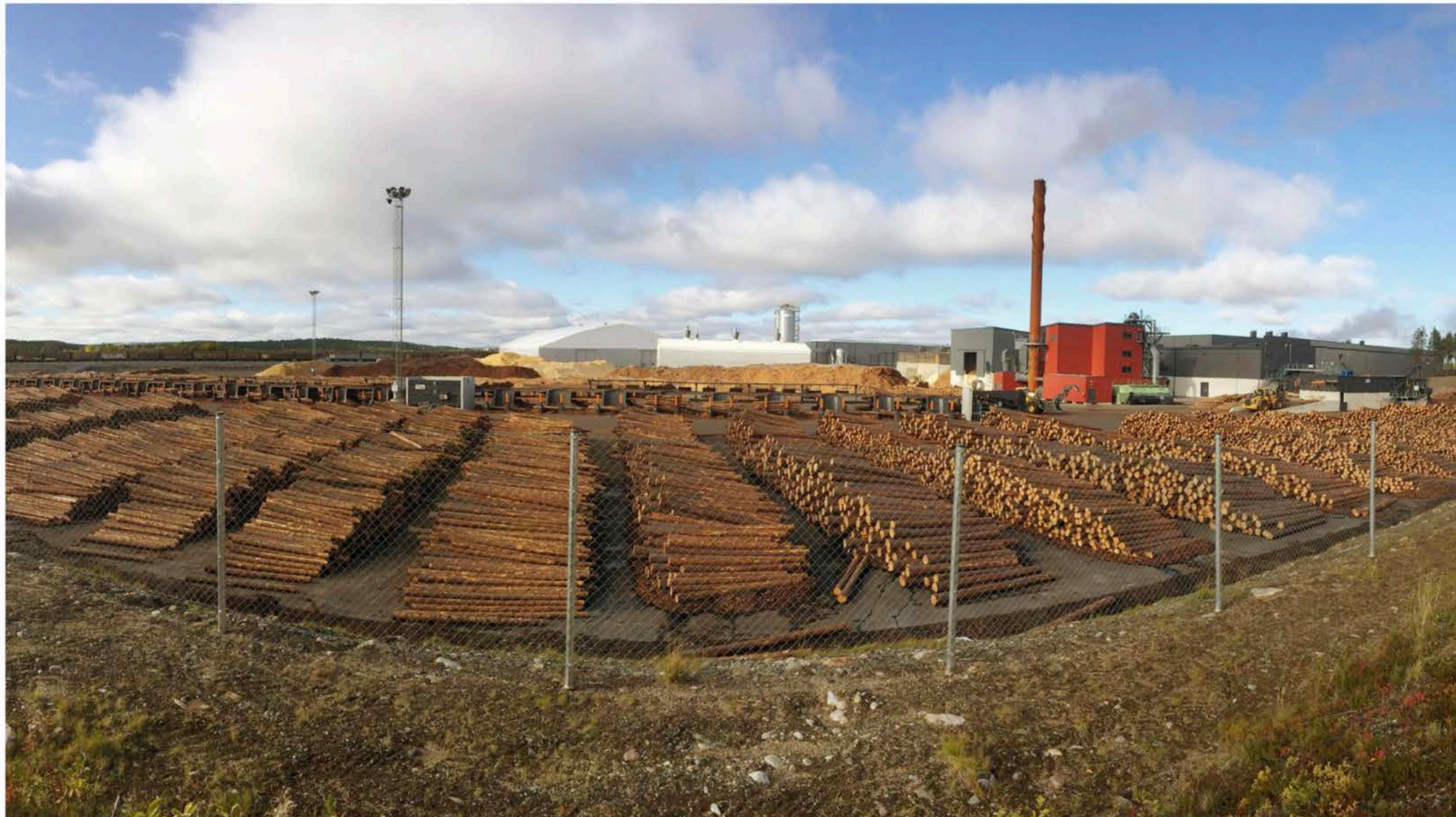
Keitele Groupin Kemijärven tuotantolaitosten kehitys on ollut ketterää. Yhtiö käynnisti sahan ja liimapuutehtaan kuutisen vuotta sitten. Nyt alueella toimii myös pellettitehdas.

Keitele on perustettu vuonna 1981, ja viime keväänä yhtiö tiedotti